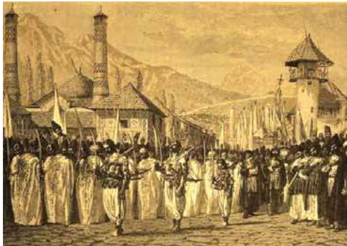
Aşura mərasimi. Şuşa Cümə məscidinin qarşısı. Rəssam Vasil Vereşaqin.

İbrahim xanın Gürcüstan tavatından olan Yevgeni Abaşidzenin qızı Cəvahir xanımdan olan qızı Gövhər Nisə/Ağa Şəki və Xoy xanı Batmanqılınc ləqəbli Cəfərqulu xan Dünbülü Xoyskinin xanımı idi. Onun nüfuzu nəinki Qarabağda, Azərbaycanın digər xanlıqlarında və bütün Qafqazda qəbul olunurdu. Gövhər ağa Şuşa şəhərində hər iki Cümə məscidini öz vəsaiti hesabına inşa etdirmiş, sonra bir çox vəqfləri həmin məscidlərin saxlanılmasına vermişdir. Məscidin divarına həkk olunan vəqfnaməyə görə özündən malına-mülkünə sahib duracaq övladı olmadı-