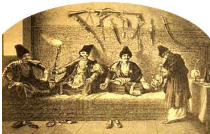
Şuşa sakinlərinin istirahət vaxtı. Rəssam Vasili Vereşaqin.