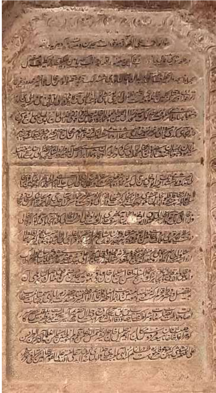
Yuxarı Gövhər ağa mascidin kitabələrindən biri