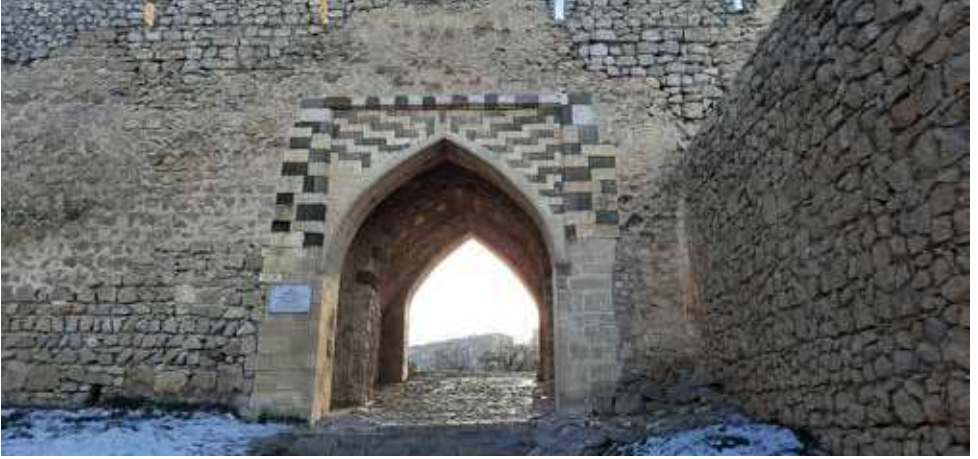
Şuşa qalası Gəncə qalası

içərisində daş və əhənglə inşa etdirir. Həmin imarətə yalnız bircə yol olduğunu qeyd edir (Qarabağnamələr 2006: 162). Baharlı yazır ki, İbrahim xanın xəzinəsi Xəzinə qayası adlanan yerdə qalıb. Ələ düşməyib. İbrahim xanın xəzinəsini bu möhkəm qayalarda basdıran Batmanqılınc Məhəmməd bəy hesab olunur. Basdıran adamları da kənarlaşdırırlar. İbrahim xan və Məhəmməd bəy - hər ikisi öldükdən sonra xəzinənin yeri naməlum qalıb. Çox adamlar gedib orada olan evləri və kahaları axtarıblar, bir şey tapmayıblar. Xəzinə qayasındakı kahalar çox qəribədir. Kahalara əvvəllər insan ayağı dəyməsə də İbrahim xan orada tikinti işləri aparıb. Kahalara çox çətinliklə çuxur açdırıb. Kahanın birinə Sulu kaha deyirlər. Onun dərinliyi on beş arşın (on metr), eni altı arşın (dörd metr), içi səkkiz arşın (altı metr) olar. Ortasından soyuq və şirin suyu olan bir böyük bulaq axır. Yanındakı digər kahaya enmək üçün İbrahim xan daş pilləkən bağladıb. Kahalarda adamı vahimə basır. Bəzən kahaların sonunu dərk etmək olmur. Bu iki kahalar İbrahim xanın imarətlərinin yanındadır. Kahalara neçə də qala əhalisi gedib məşəl və fanar yandırılıb, amma irəliləyə bilməyiblər. Çünki həmin kaha o qədər dərinidir və qaranlıqdır ki, içinə girmək olmur. Onun dibindən bir elə bərk külək gəlir ki, nə məşəl, nə də fanar davam gətirir. Xəzinə qayası, kahalar və İbrahim xanın oradakı tikililəri maraqlıdır və baxmağa dəyər. Həsən İxfə Əlizadə yazır ki, Ağsa Məhəmməd şahın sarayından və Qarabağdan əlinə keçmiş çoxlu qızıl,