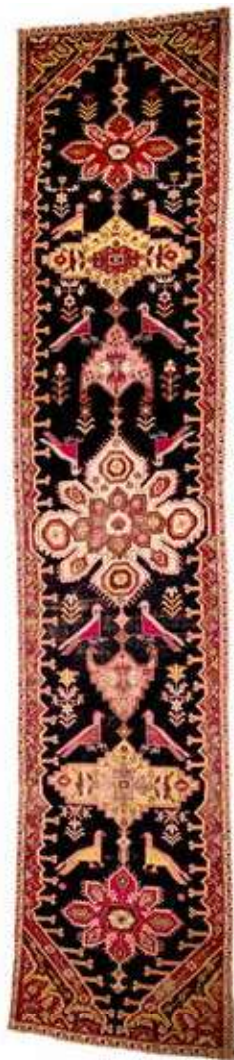
Xalça "Ləmpə". Yun, xovlu. XX əsrin əvvəli. Azərbaycan Milli Xalça Muzeyi, inv. № 7523

olurlar" (Алекперли 2001, 15). Şuşada həmin təbii-coğrafi şəraitin, eyni zamanda münbit musiqi mühitinin təsiri ilə böyük əksəriyyət xalq musiqisini ifa edə bilirdi. Şuşa camaatı tez-tez bulaq başına toplaşar, məclislər qurar, bu məclislərdə mütləq xanəndələr olardı. Çal-çağır səsi hər tərəfi bürüyərdi. Uşaqlar beləcə körpəliyindən həmin musiqilərin, eyni zamanda anaların muğam üstündə çaldığı laylaların sədası altında böyüyər, musiqi onların qan yaddaşına hopardı. Bu hal xalq arasında dolaşan "qarabağlı uşaqlar segah üstündə ağlayar, şahnaz üstə gülərlər" ifadəsində öz əksini tapmışdır. Şuşa şəhəri bu xüsusiyyətlərinə görə Qafqazın "musiqi konservatoriyası"na çevrilmişdir. "Şuşa musiqiçiləri Azərbaycan musiqisinin tarixini yaradırdılar və onu yalnız vətənlərində deyil, digər Şərq ölkələrində də təqdim edirdilər" (Виноградов 1938, 9). Sergey Yesenin bu fikirləri obrazlı şəkildə ifadə edirdi: "Əgər oxumursansa Şuşalı deyilsən".