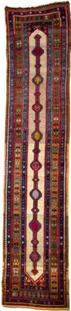
Xalça "Naxçıvan". Yun, xovlu. XX əsrin əvvəli. Azərbaycan Milli Xalça Muzeyi, inv. № 5643

geyimində uyğunluq var idi. Çünki, cənubi Azərbaycan geyimləri ilə şimali Azərbaycan geyimləri eyni kökə malik idi. İran erməniləri həmin bölgənin azərbaycanlılara məxsus geyim elementlərini, yəni çuxa, arxalıq, dəri papaqlar və s. əvvəldən də geyinirdilər. Onlar Azərbaycanda məskunlaşdıqdan sonra mövcud olan məhəlli elementləri də asanlıqla mənimsədilər. Türkiyədən köçürülən ermənilər isə Azərbaycana Osmanlı Türkiyəsi üçün xarakterik olan geyimlərlə gəlmişdilər. Dövrə aid mövcud rəsm və foto nümunələri fikrimizi təsdiqləyir.