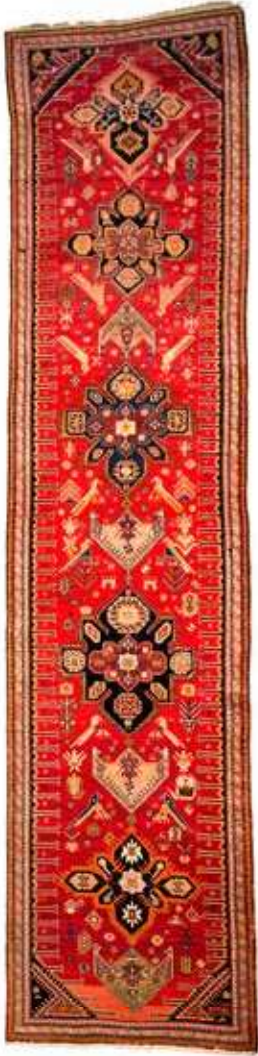
Xalça "Ləmpə". Yun, xovlu. XX əsrin əvvəli. Azərbaycan Milli Xalça Muzeyi, inv. № 3056

43 sm-dən 57 sm-ə qədər, yan çapıqları (yarmaqları) 2 sm-dir. Müqayisə üçün qeyd edək ki, Bakı və Şamaxı çərkənlərinin boyu əsasən 56-63 sm-ə, yan çapıqları isə 8-10 sm-ə çatır.