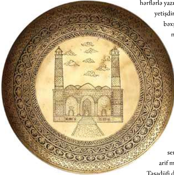
Mis nimçə.

Şuşanın mənəvi mədəniyyətinin bir parçasını da idman təşkil edirdi. Burada İbrahimxəlil xanın əsasını qoyduğu zorxana Cəfərqlu xan tərəfindən inkişaf etdirilmiş, həmin zorxanada Yaxın şərqdə və Qafqazda böyük şöhrət qazanmış Nabat, Seyid Həsən kimi pəhləvanlar yetişmişdi. Şuşada ənənəvi hal almış at yarışları "Cıdır düzü" toponimində öz izlərini qoymuş, baharbənd oyununu, dirədöymə, papaqaldı-qaç və s. oyunlar gənclərin sevimli məşğuliyətinə çevrilmişdi.