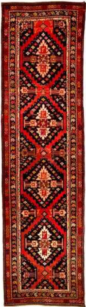
Xalça "Açma-yumma". Yun, xovlu. XX əsrin əvvəli. Azərbaycan Milli Xalça Muzeyi, inv. № 6857

At və onunla əlaqəli bütün bu dəlillər türklərdə atla bağlı çox qədim bir ayin ənənəsinin olduğunu göstərməklə yanaşı, eyni zamanda, türk-at adı qoşa səsləndiyinə görə, bu tapıntılar xalqımızın etnogenezinin öyrənilməsində böyük önəm daşıyır (Abdulova 2012, 675).