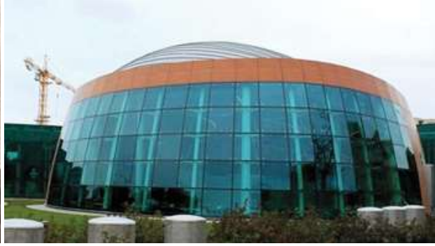
Azərbaycan Beynəlxalq Muğam mərkəzi