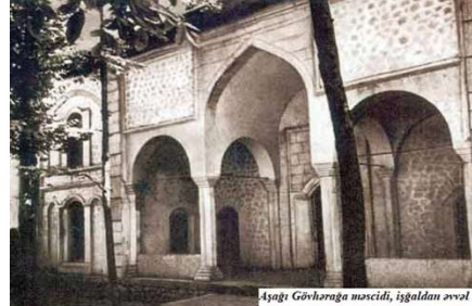
Aşağı Gökhanrağa mescidi, işğaldan əvvəl